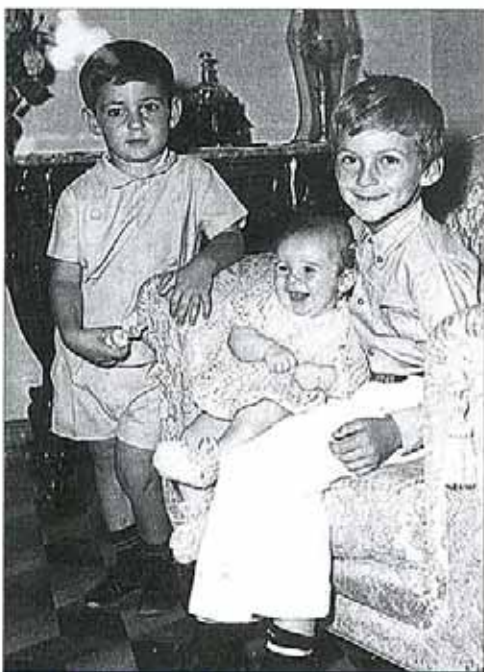
OS TRÊS IRMÃOS EM 1967: XANA AINDA BEBÉ

As marcas ainda estão bem visíveis, tanto na sociedade como nas infraestruturas. Faltam quadros qualificados e falta quase tudo em termos de infraestruturas. É extraordinário. »