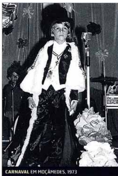
CARNAVAL EM MOÇAMEDES, 1973