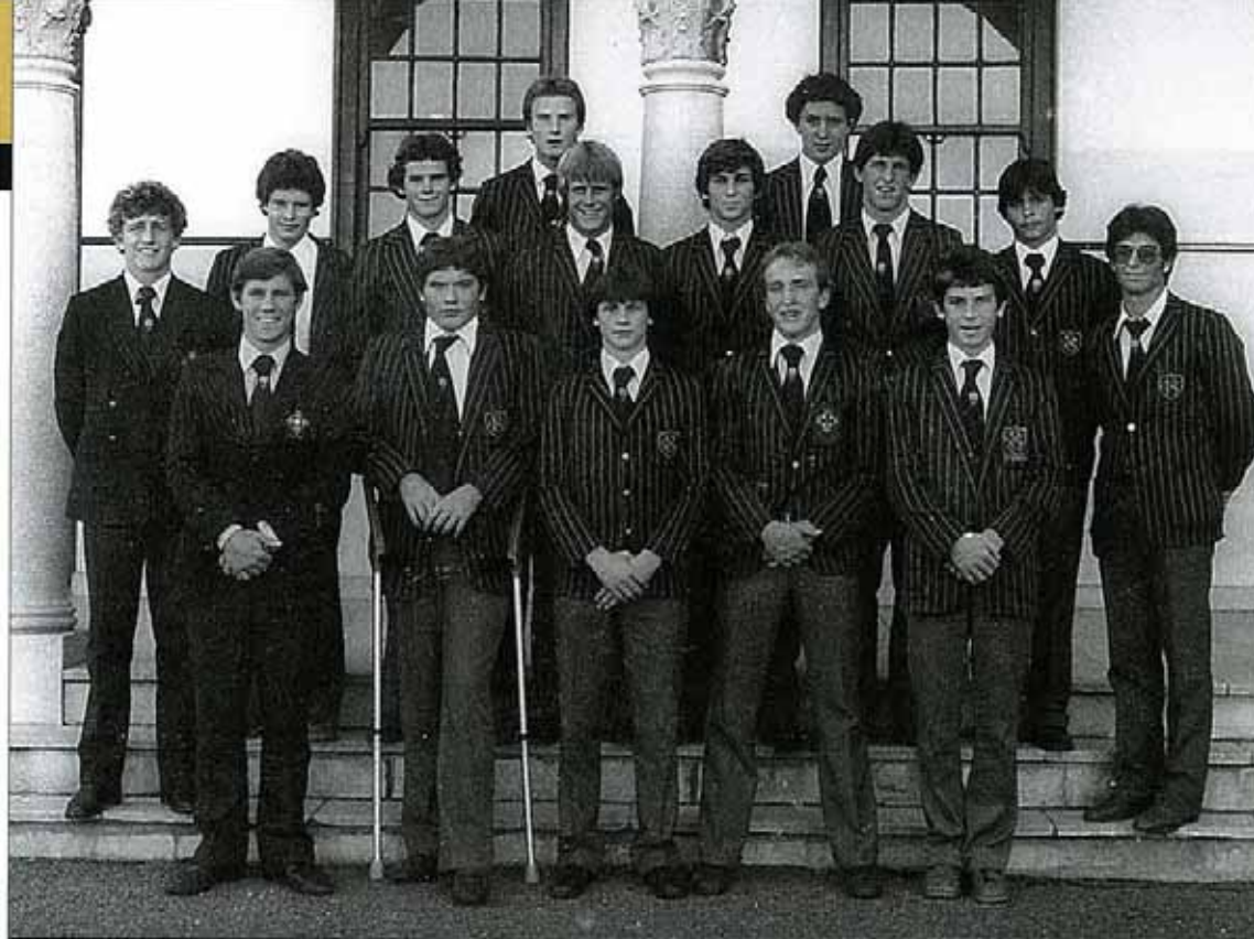
ESTUDANTE NO LICEU CHRISTIAN BROTHERS, NA CIDADE DO CABO, EM 1977

Durante a guerra, Angola perdeu todos os empresários e grupos empresariais com capacidade técnica e económica para desenvolver o país. Hoje,