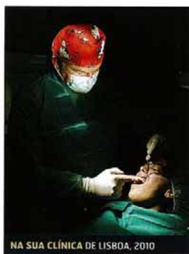
NA SUA CLÍNICA DE LISBOA, 2010