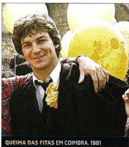
QUEIMA DAS FITAS EM COIMBRA, 1981