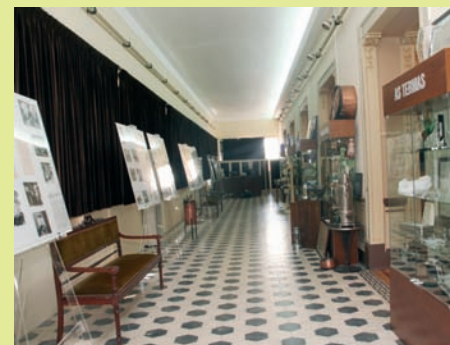
ESPAÇO está instalado no Casino

algun do património histórico relacionado com as termas. Desde duas banheiras semicúpulo, do século XIX, passando a camas de irrigações e outros aparelhos do balneário termal dos anos 40, aquele espaço permite aos utentes e visitantes ficarem a conhecer um pouco melhor a história da estância termal. |