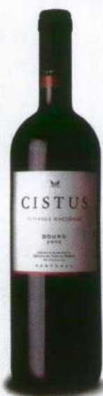
CISTUS TOURIGA NACIONAL 2008 DOC DOURO CISTUS

Vermelho tintado, com aromas de fruta muito madura e succulenta. Vinho carregado de boa fruta a conseguir trazer uma boca estruturada e moderna, com taninos e tostados bem casados com a frescura da fruta. Vinho triunfante em qualquer jantar.