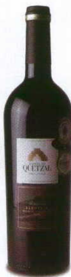
QUINTA DO QUETZAL RESERVA 2008 DOC ALENTEJO QUINTA DO QUETZAL

Aromas intensos de frutos vermelhos de baga pequena e flores de campo, com notas de chá, boca intensa de fruta e taninos correctísimos, num balanço de corpo e longevidade muito agradáveis.