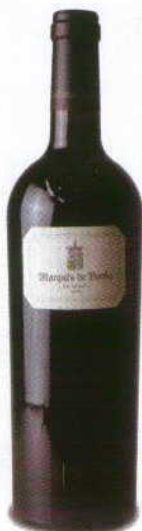
MARQUÊS DE BORBA RESERVA 2009 REGIONAL ALENTEJO J. PORTUGAL RAMOS

Cor ruby opaco. Tostas e alguns secos de especiarias e frutos, boca com fruta madura e passa, num vinho equilibrado pela frescura dos taninos compensada pelo corpo da fruta madura.