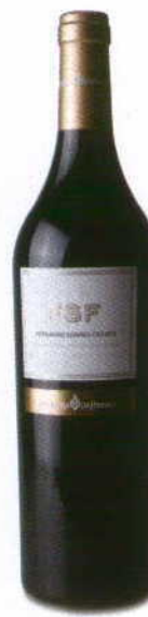
FSF FERNANDO SOARES FRANCO RESERVA 2007 REG. PENÍNSULA SETÚBAL JOSÉ MARIA DA FONSECA

Núcleo vermelho com auréola atijolada. Fruta madura e fresca com nuances florais e de giesta. Boca suave, pouco marcada pelos taninos, num conjunto balanceado e equilibrado.