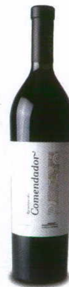
RESERVA DO COMENDADOR RESERVA 2007 REGIONAL ALENTEJO ADEGA MAYOR

Auréola acastanhada, de núcleo rubro, aromas de esteva e folhas de chá. Boca balanceada pela fruta fresca não muito presente, e com taninos á solta por entre o corpo não muito alto deste exemplar.