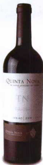
TN GRANDE RESERVA 2009 DOC DOURO QUINTA NOVA NOSSA SENHORA DO CARMO

Cor ruby opaco. Fruta de bosque, cerejas e geleias, boca marcada pela fruta algo madura e taninos apimentados, tornando um conjunto bem estruturado entre frescura e corpo.