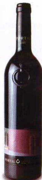
PORTAL GRANDE RESERVA 2007 DOC DOURO SOCIEDADE QUINTA DO PORTAL

Vermelho rubro. Muita fruta do bosque e aromas florais e de campo. Boca cheia de fruta e notas já presentes de cravinho, tabacos e frutas passas, numa boca muito marcada pelos taninos intensos. Um vinho a pedir pratos de forno.