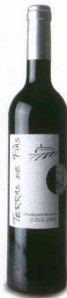
TERRAS DE PIAS RESERVA 2008 REGIONAL ALENTEJO MONTE DA CAPELA

Notas acastanhadas na cor, aromas fumados, de chá com frutas de caroço passas e tâmaras. Boca fácil, denso e ligeiramente doce. Taninos fáceis.