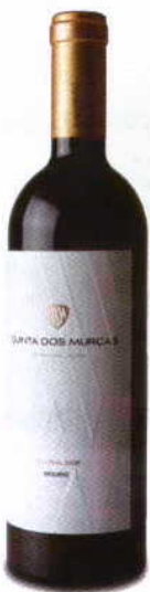
QUINTA DOS MURÇAS RESERVA 2008 DOC DOURO ESPORÃO

Cor rubro intenso. Frutas maduras, ameixas e violeta com nuances de mentol. Boca gulosa, pela fruta madura e taninos redondos, com um final longo e correcto.