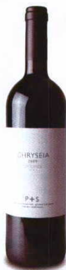
CHRYSEIA 2009 DOC DOURO SYMINGTON FAMILY ESTATES

Aromas frescos, de bosque e algum mentol, com fruta vermelha bem presente. Boca fresca pela fruta não muito madura, taninos bem delineados, corpo firme a algo austero. Para durar mais alguns anos.