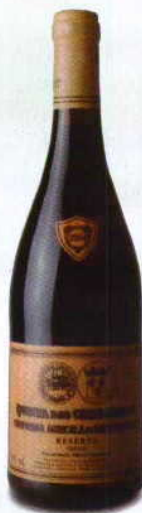
QUINTA DAS CEREJEIRAS RESERVA 2004 DOC LISBOA COMP. AGR. DO SANGUINHAL

Cor com notas evolutivas de castanhos e tijolo. Aromas complexos, com primários de frutos secos e tâmaras, e terciários de tabaco, chás e folhas secas. Boca fresca, pela fruta já pouco presente e taninos suavizados, mas marcantes pela qualidade. Um vinho com qualidade provada aos dias de hoje.