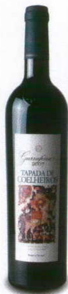
TAPADA DE COELHEIROS GARRAFEIRA 2007 REGIONAL ALENTEJO HERDADE DOS COELHEIROS

Cor ruby, com fruta preta madura e boa madeira. Denso encorpado e fresco com taninos muito persistentes. Melhor no aroma que na boca.