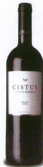
CISTUS GRANDE RESERVA 2008 DOC DOURO CISTUS

Cor ruby opaco. Aromas intensos de frutos maduros, de bosque e cereja, com alguma tosta abaunilhada criando um ênfase guloso de início. Boca untuosa, cheia pela fruta e pelos taninos bem colados. Boca longa num vinho para apreciadores.