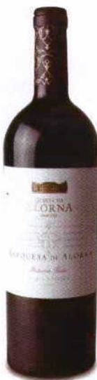
MARQUESA DE ALOMA RESERVA 2008 DOC TEJO QUINTA DA ALORNA

Vermelho intenso, com aromas de mentol, eucalipto e de pinhal, com fruta bem madura a criar um conjunto apetecível. Boca cheia, fresca e com bom balanço entre taninos e corpo correcto.