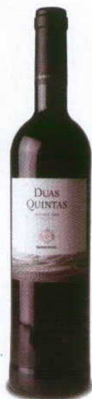
DUAS QUINTAS RESERVA 2008 DOC DOURO ADRIANO RAMOS PINTO

Vermelho rubro, com fruta madura e boa madeira com notas de chocolate, fumo e cacau. Boca cheia, untuosa pela fruta doce, longa pelos taninos presentes. Final longo, agradável e muito persistente.