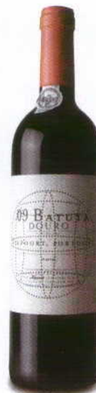
BATUTA 2009 DOC DOURO NIEPOORT

Aromas de fruta madura e muitos compostados, com perfumes florais por toda a parte. Boca vibrante, muito cheia pela fruta ainda jovem, muita concentração e taninos ainda pouco presentes, que vão fazer durar mais algum tempo este belo exemplar.