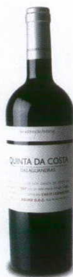
QUINTA DA COSTA DAS AGUANEIRAS 2007 DOC DOURO LAVRADORES DE FEITORIA

Cor ruby, concentração média, aroma de baunilha com notas de frutas vermelha. Boca fácil, curta e ligeiramente seca.