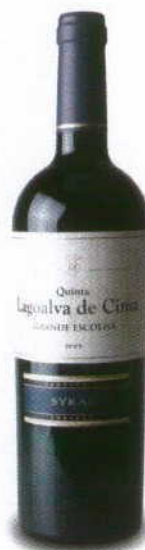
QUINTA DE LAGOALVA DE CIMA GRANDE ESCOLHA SYRAH 2008 REGIONAL TEJO QUINTA DE LAGOALVA

Cor ruby evoluído. Alguns aromas de fruta madura com mais fruta seca e de caroço, especiarias. Boca marcada pelos taninos amadeirados e secos com fruta pouco presente.