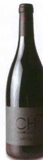
CH BY CHOCAPALHA 2008 REGIONAL LISBOA QUINTA DE CHOCAPALHA

Núcleo vermelho rubro, aromas de fruta bem madura e alguma cereja, boca fresca, madura e untuosa á fruta e frescura encontrada com qualidade. Final longo, agradável e muito persistente.