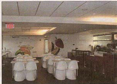
▶ O restaurante da MALOCLINICS

do Norte e não creio que nos próximos anos nasça outra de dimensão idêntica. Sentimos que vamos crescer muito nos próximos anos nos E. Unidos.