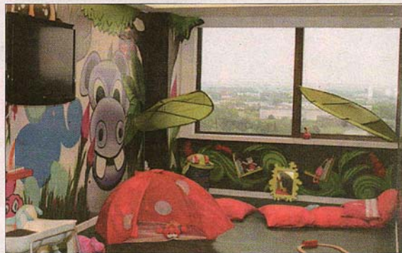
▼ Sala de espera para crianças

PM- Somos líderes mundiais na parte dentária e não é nos tratamentos básicos, mas sim nos casos graves. E quando nós trabalhamos com uma faixa etária que não é jovem, temos de olhar para outros problemas de saúde. Check-ups, prósteta, cardíacos. Na clínica de Lisboa, temos todos os sectores médicos, tal como em Macau. Nesta clínica só temos a parte dentária e dentro de um mês entra a parte da cirurgia plástica, depois cirurgia da coluna, quiropraxia e à medida do crescimento vamos trabalhando noutras áreas.