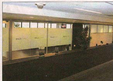
▼ Balcão de atendimento com cerca de 30 metros

dão do mundo. PM- A MALOCLINIC tem 50 funcionários em East Rutherford e está programada para ter entre 300 e 400